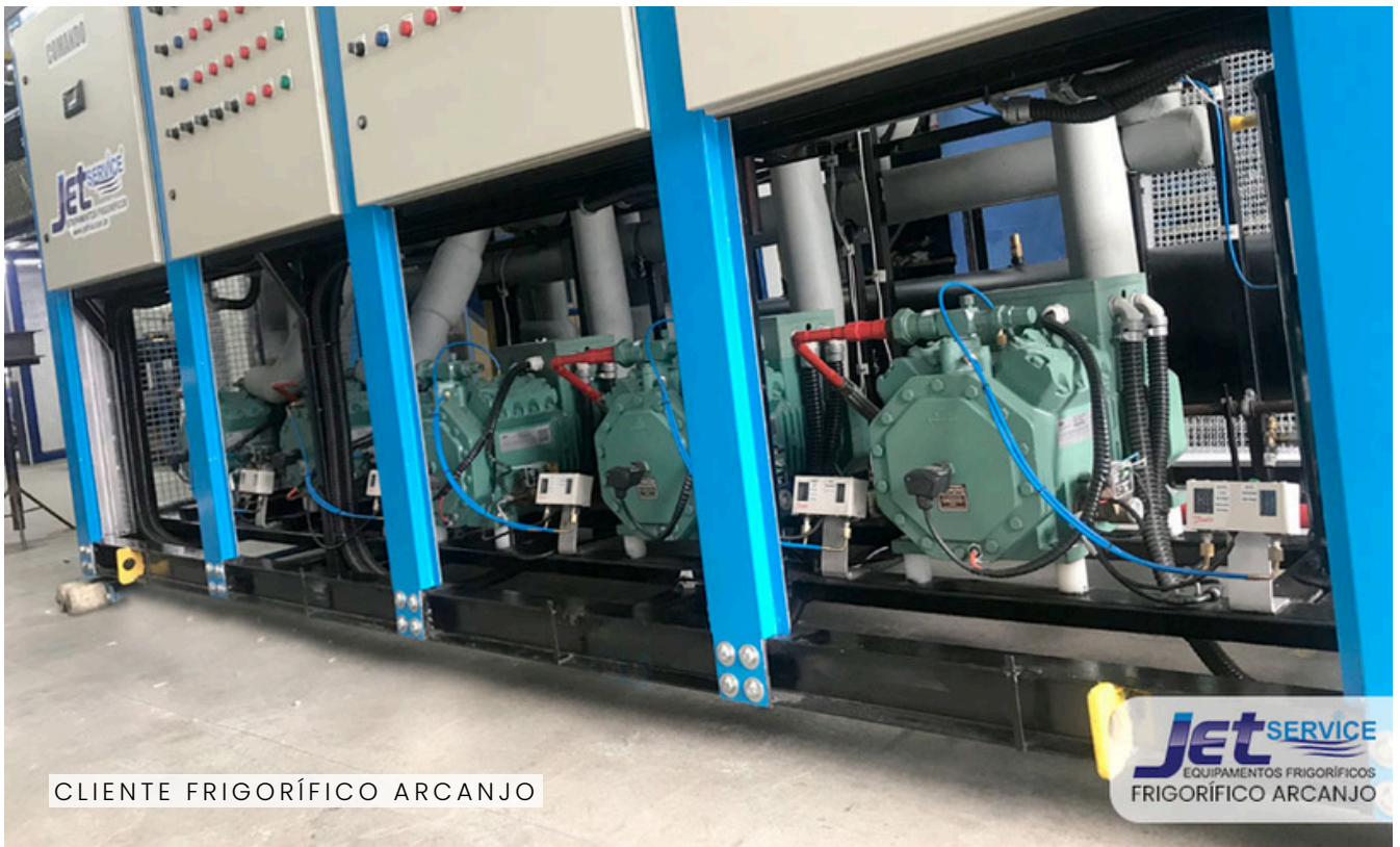
CLIENTE FRIGORÍFICO ARCANJO