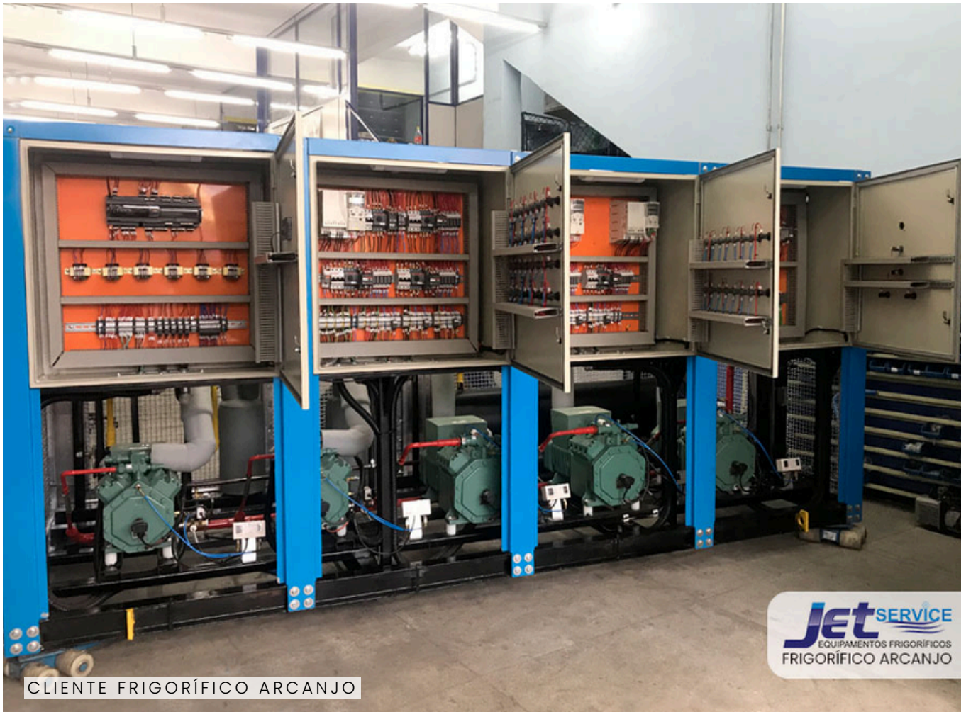
CLIENTE FRIGORÍFICO ARCANJO

U M Projeto realizado para congelamento e resfriados no Frigorífico Arcanjo, atendendo as especificações tais como eficiência energética e demanda da capacidade exigida.